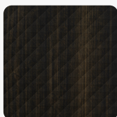
LR29 CH Cheope Fittipaldi Povrchová štruktúra Cheope