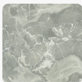
F141 ST15 Mramor Eramosa jade Povrchová štruktúra Smoothtouch Velvet