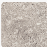
F052 ST75 Travertin Calais Povrchová štruktúra Mineral Satin