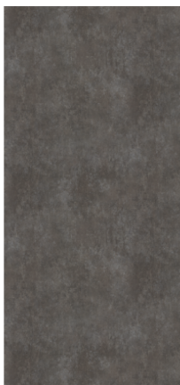
Náhľad na celú dosku