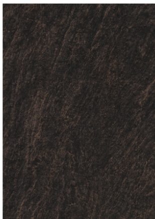
Náhľad na celú dosku